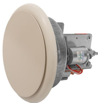
Elektrisch aangestuurd ventiel