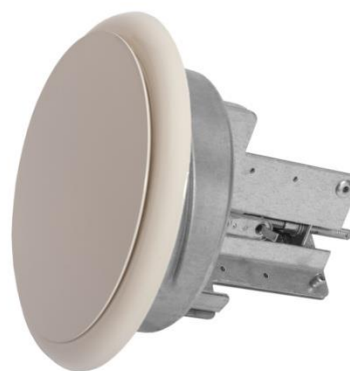
smeltlood 72 graden Celsius

Voor bestellingen: Sales@hpsmail.nl - 0593-33 17 76